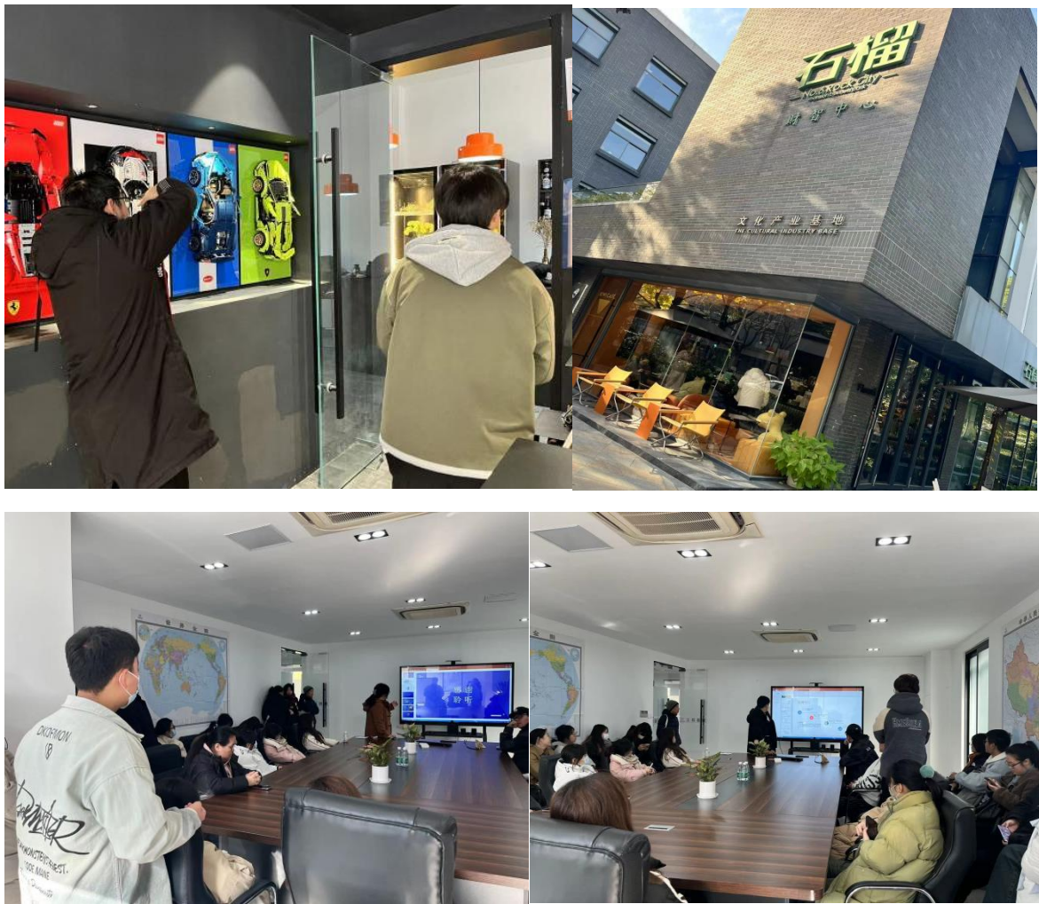
图 3-图 6： 专业教师带领学生参观江苏智檬智能科技有限公司现场教学

师生共同参与企业实地考察活动，旨在提升学生的职业认知和素养，使他们深入了解企业文化，掌握行业发展动态和企业运营机制。在专业教师的引导下，学生们与企业设计师、工程师紧密对接，探讨数字媒体技术领域的新设计模式、新设计方法和新创意路径。这些实践活动对课程体系建设产生了积极影响，同时帮助学生拓展视野，明确岗位综合能力需求，从而激发他们的学习动力。