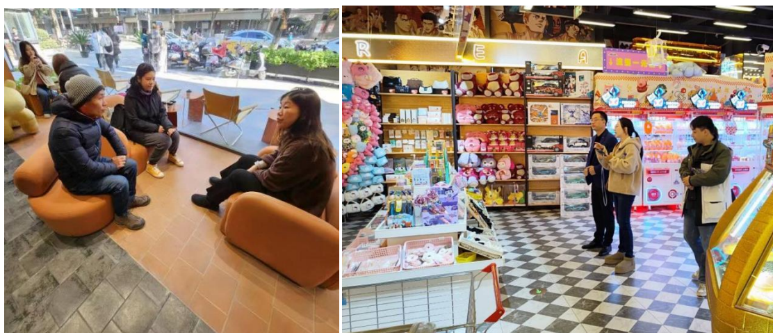
图 1、2： 专业教师就正德学院 2023 年“智檬杯”职业技能大赛实施方案与企业负责人洽谈

自2023年我院艺术与建筑工程系与江苏智檬智能科技有限公司签订校企合作协议书以来，双方建立了紧密的合作关系。为进一步深化合作，江苏智檬与正德学院将主要采用“职业技能竞赛+校内实践教学+实习岗位提供”的合作模式，专业负责人及专业教师带领学生赴该公司进行了专业建设研讨、实践教学调研以及学生参观企业座谈会等活动。这些活动旨在帮助学生了解企业运营模式、岗位需求，以及前沿的新媒体运维等领域的最新动态。此外，学生还学习了关于数字媒体技术在宣传物料制作中的应用方法，并就岗位能力提升等具体计划和工作交流展开了深入探讨。