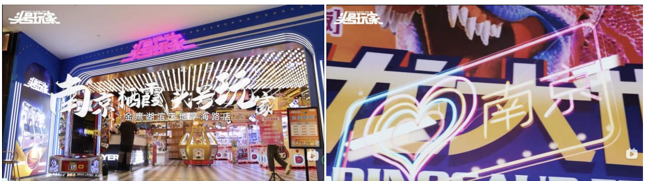
图 7-图 14：分别为“短视频达人”“未来设计大咖”“校园人气王”赛项部分作品