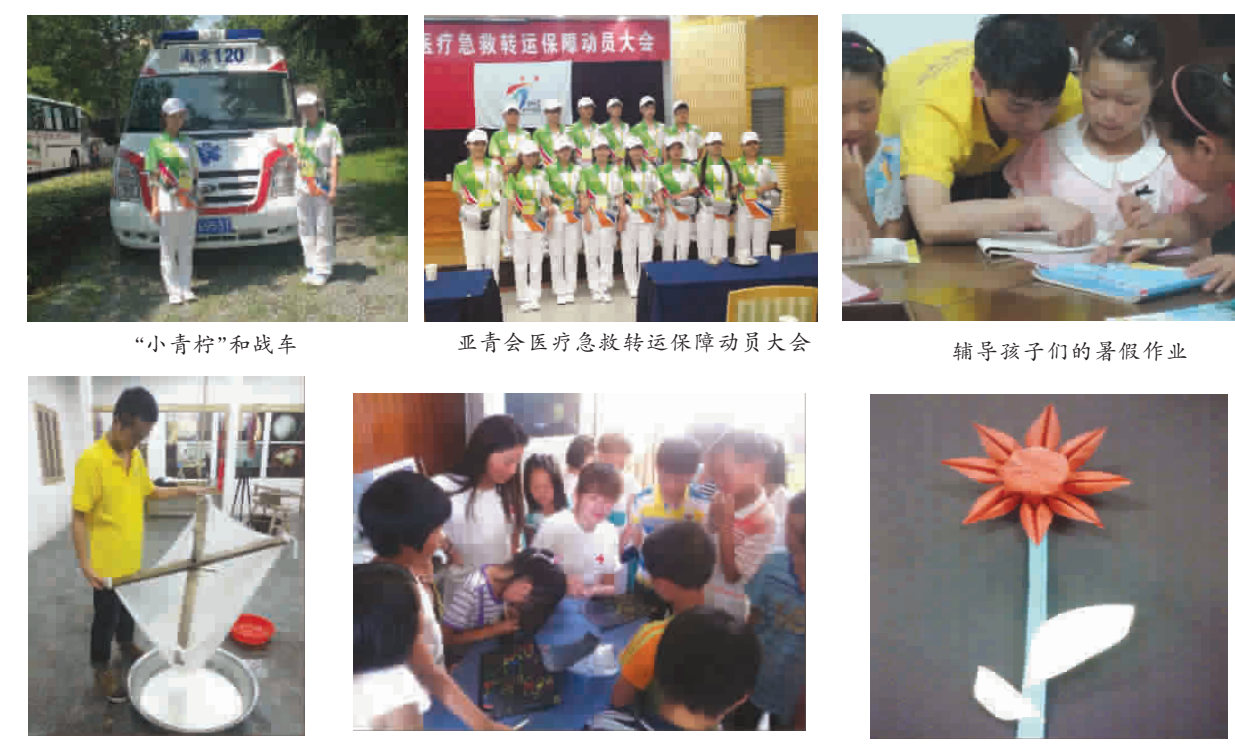
“小青柠”和战车 亚青会医疗急救转运保障动员大会 辅导孩子们的暑假作业 孩子们的手工作品 孩子们的手工作品 孩子们的跆拳道有模有样

本报(胡丹)社会实践活动能为大学生们提供更多的接触基层、了解基层的机会,通过各种形式的社会实践,可以帮助大学生们将理论与实践相结合,深化对社会的认识,找到自身的不足,并科学的定位自我。2013年6月,我院团委组织学生开展了以“实践激扬青春志,奋斗成就中国梦”为主题的暑期社会实践活动。在全院学生中遴选出的100余名同学分别奔赴亚青会赛场、安徽方边希望小学、淮安市武墩镇、江宁区汤山七坊村等地开展社会实践活动。截止8月24日,所有小分队成员收获满满,载誉归来。 暑期我院志愿者服务亚青会 我院20名亚青会志愿者在接受了为期两周的岗前培训后,自8月10日起,正式服务亚青会医疗救护工作,主要承担在比赛期间各体育场馆的赛事急救车转运工作。虽然工作辛苦,但我院的志愿者们在自己的岗位上尽职尽责,工作中微笑是他们的通用语言,“小青柠”是他们的亲切称呼,他们每天跟随医疗救护人员往返于各大场馆与救护站之间,来不及看上一眼精彩的比赛,身上鲜艳的志愿者制服,干了又湿,湿了又干,但他们却从没想过放弃,较好的体现了我院学子的精神风貌。 暑期教育帮扶活动 7月11日,教育帮扶活动两个小分队分别来到了淮安市清浦区武墩镇和安徽方边希望小学,志愿者们耐心的与孩子们面对面交流,了解其内心需求,并分小组开展了不同类型的教育活动,包括:普通话教学、音乐、舞蹈、朗诵、五字教育、体育游戏等内容。师生们还举行了“爱的信笺”活动,让孩子们学会给父母写信,表达自己的爱与思念,也让我院的“五字教育”有了更远的延伸。活动结束后,小分队成员组织了文艺汇演活动,支教大学生与在校留守儿童同台演绎,将爱心与希望完美的融合。在得知一位学生因患重病休学时,队员们自发筹集了600元人民币前往学生家中探望,并表示衷心的祝愿。 小分队体验农副产品传统的工艺制作 7月5日上午,志愿者小分队在院团委的带领下来到传承着古老的手工作坊工艺的江宁区汤山街道七坊村,分别参观和体验了七种农副产品传统的工艺制作流程,重现了明清时期江南农家自给自足的传统生产生活场景,让大家穿越时空感受到传统与现代农家生活交融的乐趣。队员们还与大学生村官一起在游客中心利用新媒体扩大该村网宣平台建设。此次的汤山七坊之行,队员们领略了生动的农俗,加深了对农村建设事业的理,丰富了大学生们的阅历。