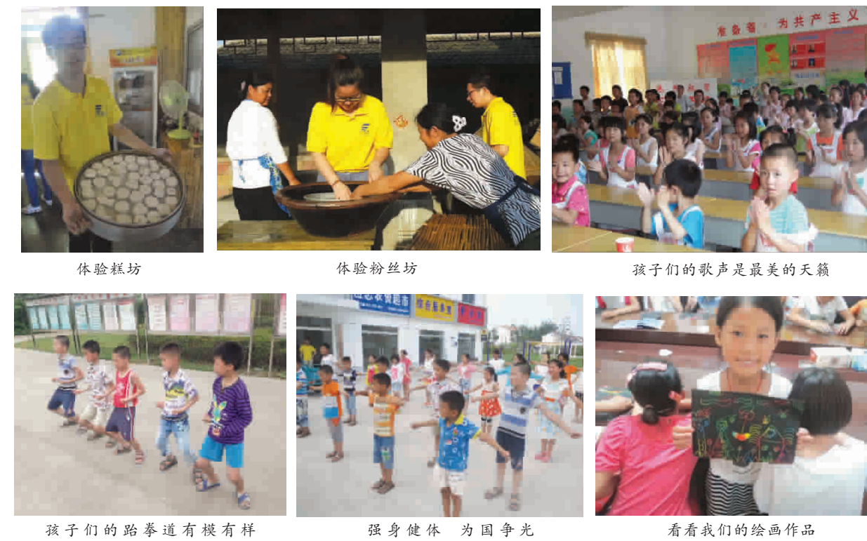
体验豆腐坊 绘画及手工制作课程 体验粉丝坊 体验糕坊 孩子们的跆拳道有模有样 强身健体 为国争光 看看我们的绘画作品

本报(党政办)为期三天的2013年暑期干部研讨会于28日上午落下帷幕,会议期间,与会人员围绕会议主题“以迎接评估为契机,进一步提升工作水平和质量”展开热烈讨论。学院教务处处长章庆国和院长助理兼学生处处长王健还分别就学院几年来在教学管理和学生管理方面进行的改革探索以及取得的成绩和对做好迎评工作的思考,专题向机关单位干部和各系学生工作负责人作了汇报。很多中层干部反映,这次会议虽然日程安排比较紧凑,但是由于大家准备都比较充分,讨论紧扣主题,大家都感觉三天会议开得很充实,收获比较大。 在教学组讨论中,不少发言同志为此次会议准备了精美的PPT,机电工程系主任马金平以数控技术专业为例,谈了自己进行专业剖析的体会,刘小廷副院长对她的发言表示肯定,他指出专业剖析尽量要脱稿,口语化;要以实际案例来增强说服力;专业特色凝练要突出重点。教务处处长章庆国就专业自评报告的撰写做了介绍;民用航空系主任徐飞、学院迎评办公室主任任丽君等分别就各自分工工作谈了自己意见。 在由院系学生工作负责人组成的第二组讨论会上,丁秀东就学生口如何更好的参加迎评工作指出:评估指标体系要做出内涵,做出亮点和特色,学生管理干部态度要端正,工作方法要得当。学生处及各系学生工作负责人分别结合本系学生工作的内容和特点,从教学管理、课程改革、社会实践、招生、就业等方面先后表态发言,表示要严格按照学院安排,对照学院迎评工作要求,扎实做好好管理迎评工作。沈秀其老师前不久曾前往台湾高校考察,他在发言中结合本次去台湾学习的感受,介绍了台湾高校品德教育的一些做法和经验,为我校“孝、宽、诚、责、毅”五字教育提供参考。院长助理兼学生处处长王健指出:面对注册入学的学生,我们要树立新的人才观,评价人才的标准