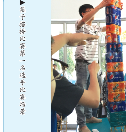
筷子搭桥比赛第一名选手比赛场景