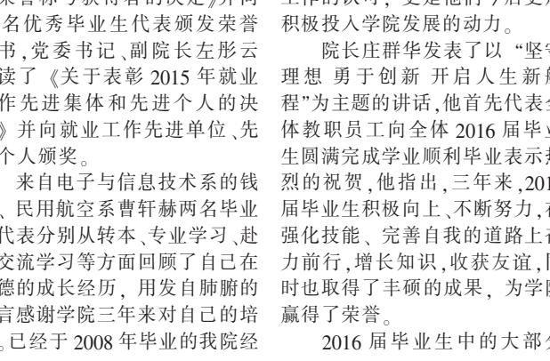
学院领导和优秀毕业生合影留念