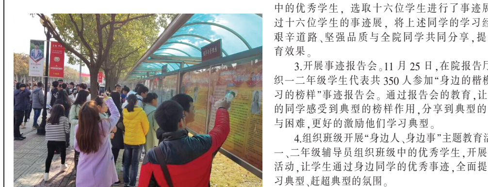
朋辈引航活动掠影

为充分挖掘学生中的先进典型,以及联系优秀校友等形式,遴选出学习榜样、社会实践榜样、励志榜样三类榜样典型,每类榜样3人,入选系级的朋辈榜样信息库。