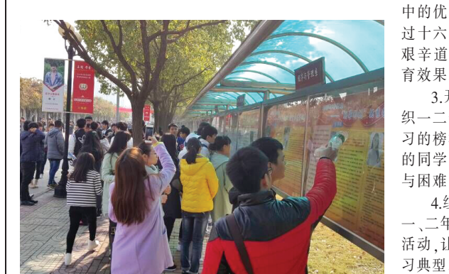
朋辈引航活动掠影

为充分挖掘学生中的先进典型,以及联系优秀校友等形式,遴选出学习榜样、社会实践榜样、励志榜样三类榜样典型,每类榜样3人,入选系级的朋辈榜样信息库。