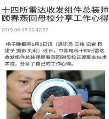
《扬子晚报》报道版面