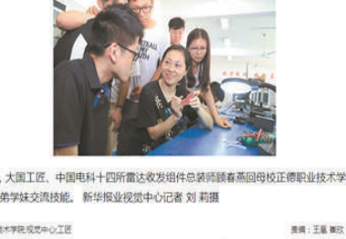
《中国江苏网》报道版面