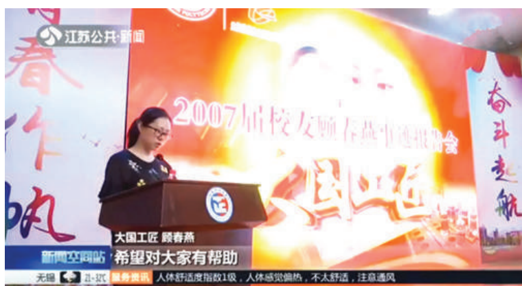
《江苏卫视》报道版面