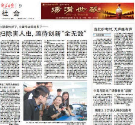
《新华日报》报道版面

报道充分展示了我院校友的优秀风采,也是对我院多年来育人成绩的肯定,较好地提升了学院的社会影响力。