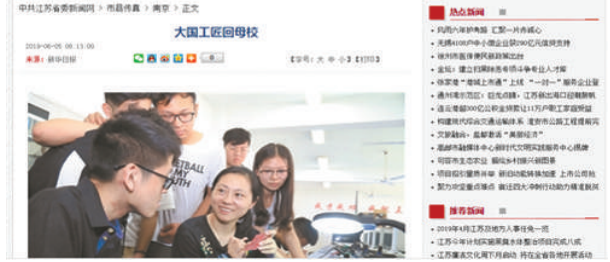
《大国工匠进校园》报道版面