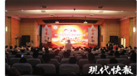
《现代快报》报道版面