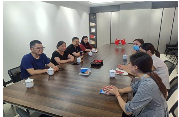
图 1、2：专业负责人及专业教师和南京铭望装饰公司举行课程建设交流