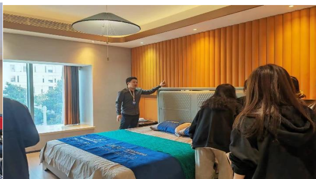
图 3-图 10： 专业教师带领学生参观铭望装饰公司现场教学

通过师生走进企业参观走访，进一步提高学生职业意识、职业素质，学习了企业文化，了解了行业发展和趋势、企业运行机制。专业教师对接企业设计师、工程师，了解了装饰装修的新设计工作模式、新材料新工艺，对课程建设起到很大的作用。学生拓宽了视野，了解岗位综合能力需求对专业学习起到了促进的作用。