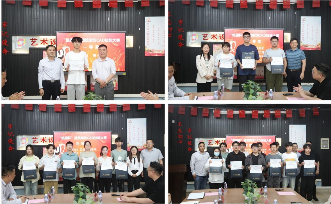
图 15-图 22：2023 “铭望杯”举办过程