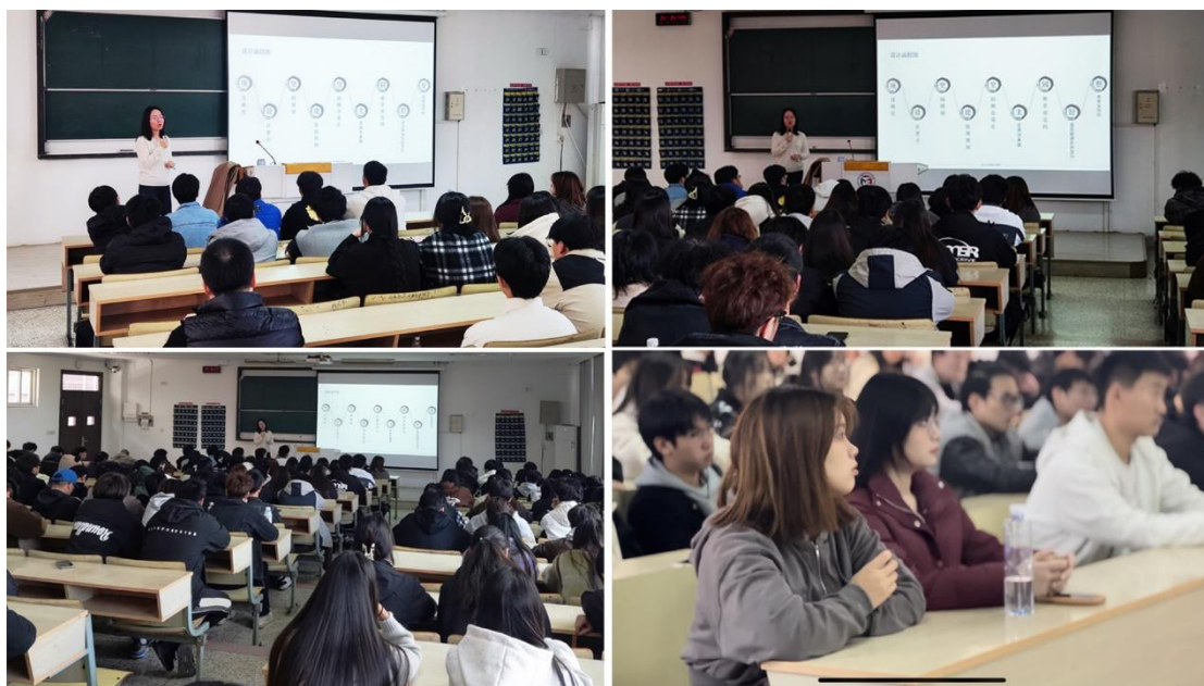
图 11-图 14:企业设计师走进校园做讲座

为进一步深化校企合作、构建协同育人新格局，提升学生职业意识和素质，系部积极开展好“企业专家进校园”系列讲座计划。邀请企业设计师进校讲座，分享设计过程和设计方法，提高了学生的专业能力。