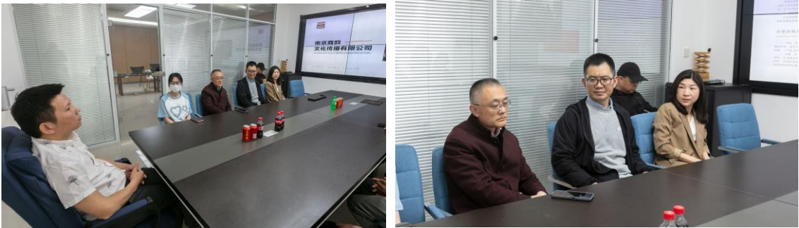
图 1、2：专业负责人及专业教师和南京商韵文化传播有限公司交流

自2019年11月我院艺术与建筑工程系与该企业签署校企合作协议书确立校企合作关系以来，校企双方保持良好的交流合作。2023年双方进一步深化了合作内容，本学期在专业负责人老师和专业教室的带领下赴南京商韵文化传播有限公司开展了专业建设研讨、实践教学调研、看望实习生等活动。