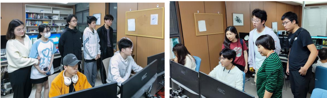
图 3-4：专业教师带领学生参观南京商韵文化传播有限公司

通过师生走进企业参观走访，进一步提高学生职业意识、职业素质，学习了企业文化，了解了行业发展和趋势、企业运行机制。专业教师对接企业设计师、工程师，了解了动画设计工作模式、新技术，对课程建设起到很大的作用。学生拓宽了视野，了解岗位综合能力需求对专业学习起到了促进的作用。